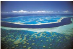
Outer Barrier Reef

Tag zur freien Verfügung oder optionaler Ausflug in den Daintree Nationalpark mit Daintree River Cruise, Besuch einer Obstfarm und Wanderung mit einem Aborigine des Kuku Yulanji Stammes, inkl. Mittagessen (siehe „Sonstige Preise“). Gemeinsames Abschieds-Abendessen im Hotel. Übernachtung im Hotel.