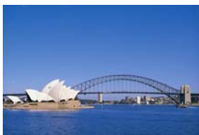
Sydney - Oper