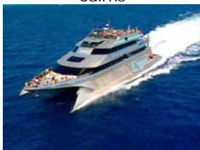
Ausflugsboot Barrier Reef